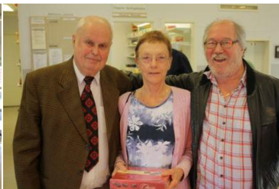
Prispall i singelturnering