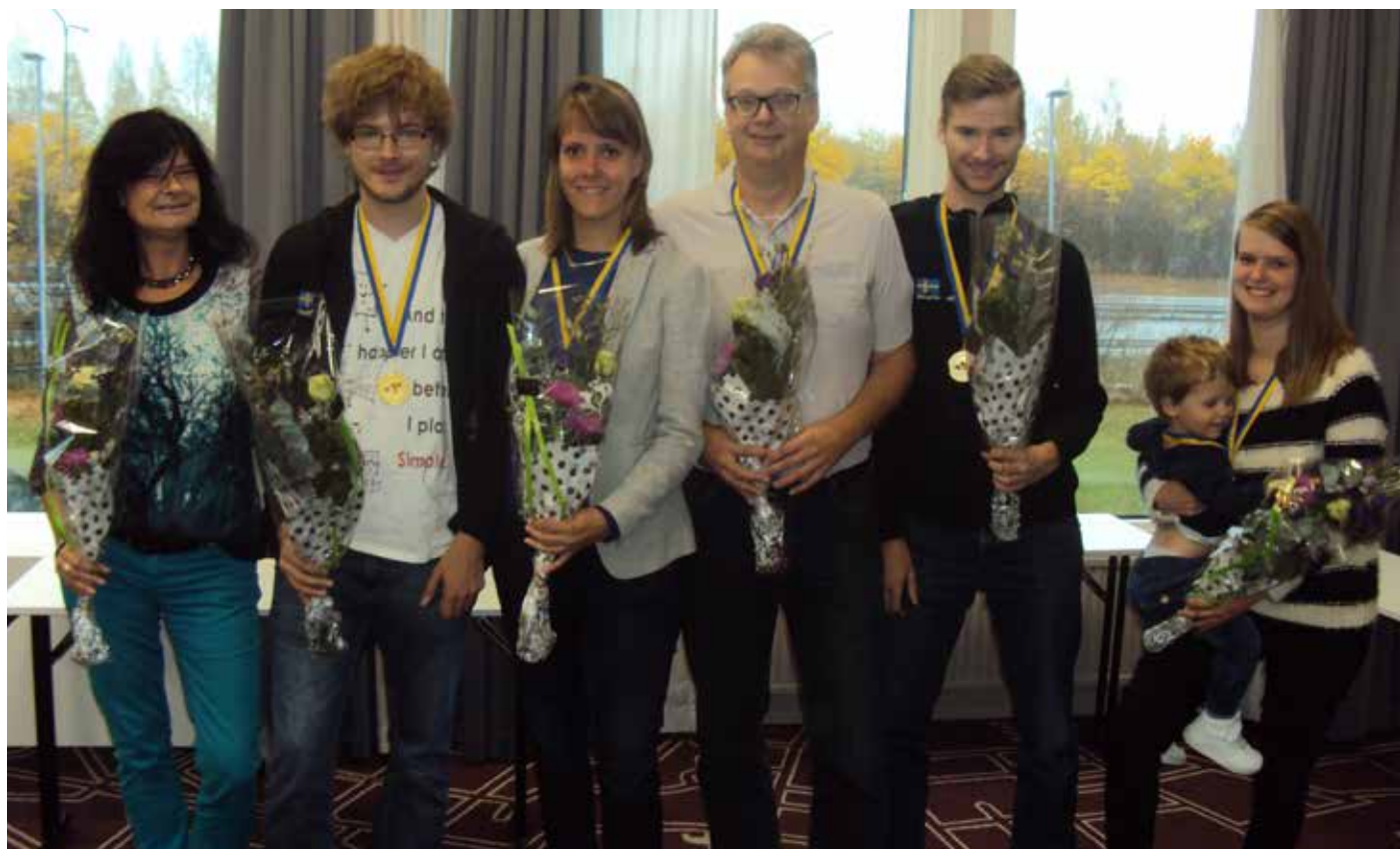
>>> Harplinge BK - klara vinnare av Allsvenskan 2016 redan innan sista matchen spelades.

Som vanligt utgår den en rabatt för de lag som anmäler sig och betalat så att startavgiften är SBF tillhanda senast den 14 december 2016. Lag som anmäler sig före detta datum är även med i utlottning av bridgelitteratur och andra fina priser!